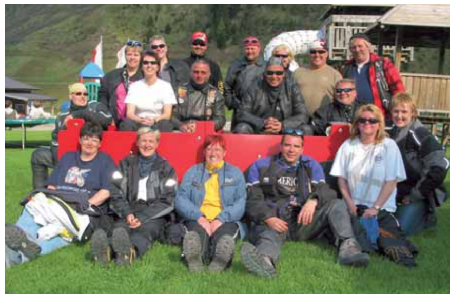
Ein bunt zusammen gewürfelter Haufen. Alle kamen aber gut miteinander klar.

Norden. Es erwartet uns noch ein letztes Highlight. Der Almauftrieb hat begonnen. Viele Kühe traben über den Gerlospass hinauf zu die Almen. Wir müssen einen Kuhfladenslalom absolvieren und wehe der Vordermann trifft einen davon! Ich wurde voll getroffen! Allerdings geht das grünbraune Zeug, wenn es trocken ist, relativ leicht wieder ab und riecht dann kaum noch. Ein letzter Tankstop in Österreich. Hier kostet der Sprit deutlich weniger als in Deutschland. Kurz vor dem Achensee erwischt uns dann der Regen. Es sieht nicht nur nach einem Schauer aus, aber unser Anführer hat alles fest im Griff. Eine Tagesetappe mit 450 Kilometern über die Runden zu bringen, ist selbst für einen erfahrenen Tourguide nicht so einfach. Alle verhalten sich aber gerade