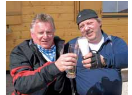
Radler und Sonnencreme. In diesen Höhen verbrennt man trotz Helm schnell das Gesicht.

Danach düsen wir flott zurück ins Tal. Unser Weg führt uns weiter zum Schlegeisspeicher, dem südlichsten Punkt des tief in die Landschaft eingeschnittenen Tales. Wieder müssen wir zehn Euro Maut löhnen, werden dafür aber mit zwanzig äußerst kurvigen und eindrucksvollen Kilometern entschädigt. Mehrere sehr enge und nasskalte Tunnels sorgen für weitere Abwechslung. Leider beginnt es oben zu regnen und wir müssen in die wasserdichten Klamotten. Die 131 Meter hohe Stau-