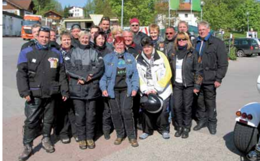
Unsere kleine Gruppe beim ersten Stopp. Trotz Sonne bleibt der „Zwiebellook“ noch angezogen.

Jeder Teilnehmer bekommt nach dem Frühstück sein Roadbook. Wir sind pünktlich um 9 Uhr reisefertig. Aufgereiht wie an einer Perlenkette triken wir über die Gerlosstraße vom Zillertal in die Hohen Tauern. Wir fahren bis Zell am See und biegen dort auf die Großglockner-Hochalpenstraße ein. Kleiner Wehrmutstropfen: Die Maut dafür beträgt pro Trike 23 Euro. Auf einer Länge von 48 Kilometern schlängelt sich die Straße durch die Ostalpen. Sie wurde 1935 gebaut und war schon seit ihrer Entstehung als Panoramastraße vorgesehen und weniger als Verkehrsverbindung. Diesen Charakter hat sie sich bis heute bewahrt. Über 29 Kehren windet sie sich wie eine Schlange den Berg hinauf. Kurz vor dem Fuscher Törl bei 2.428 Metern Höhe, zweigen wir links zur Edelweißspitze ab. Nach sieben