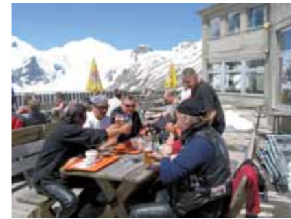
Mittagspause auf der Franz-Josefs-Höhe.

hat sich mit viel Mut und Kampfgeist sehr tapfer geschlagen.