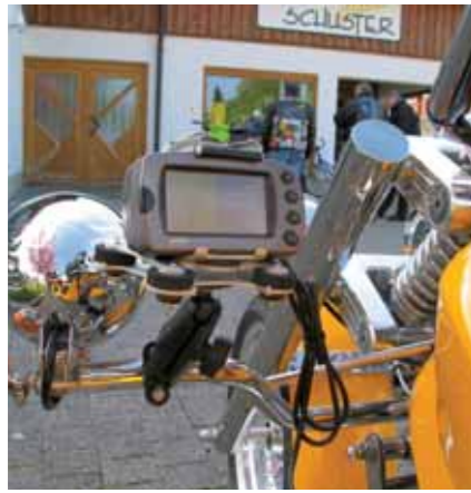
Wichtiges Utensil unseres Rudelführers, das Navi mit Sprachausgabe.

Großglockner auf der Panoramastraße bezwingen. Natürlich ein Klacks für das Navigationssystem unseres Rudelführers.