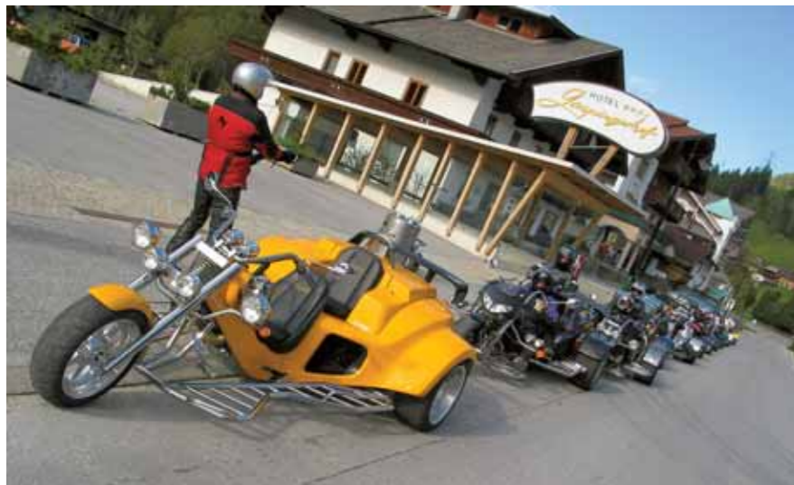
Disziplin muss sein. Vor der Abfahrt wird in Formation angetreten.