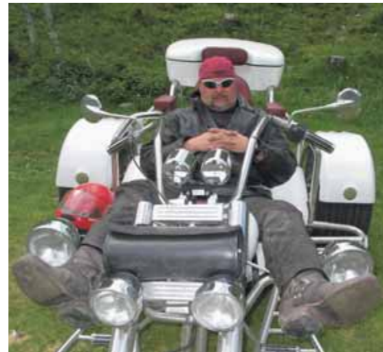
...nur ein bisschen ausruhen!

Der nächste und letzte Tag bringt zunächst Sonne, aber es wird zunehmend wolkiger. Nach dem Frühstück müssen wir leider schon unsere Trikes bepacken und den Heimweg antreten. Wir verlassen Gerlos und das schöne Zillertal Richtung